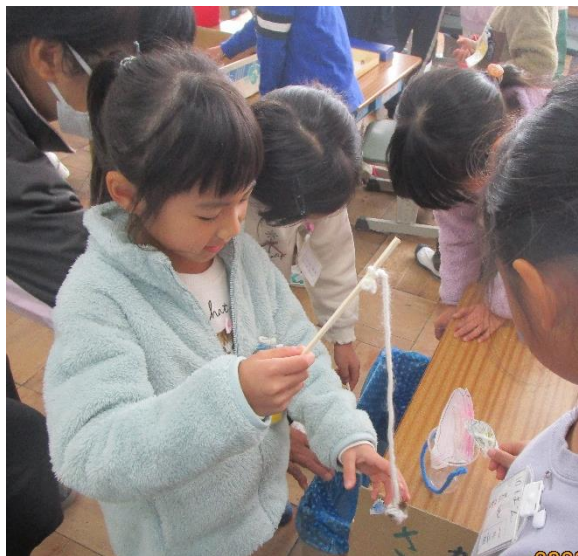
おなもみさかなつり