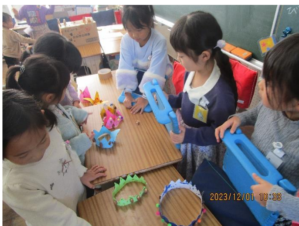
アクセサリあそび