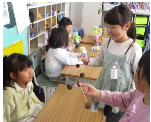
やじろべえあそび