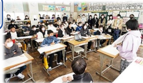
令和6年2月 参観会の様子

【その他】PTA 総会については、今年度と同じく書面での開催とさせていただきます。どうか御了承ください。