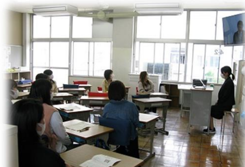
令和3年4月の学級懇談会の様子