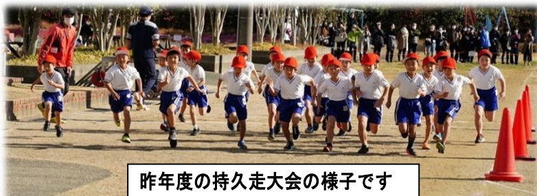
昨年度の持久走大会の様子です

当日は、マスクの着用をお願いします。また、発熱等体調不良の方は参観をお控えください。保護者の皆様には、御理解と御協力をよろしくお願いします。詳細については、各学年から発行される学年だよりをご覧ください。